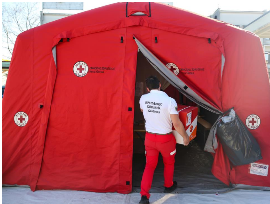
Na mejnem prehodu (pomlad 2020)

Uprava Republike Slovenije za zaščito in reševanje organizira v dogovoru z Rdečim križem Slovenije in drugimi nevladnimi organizacijami ter občinami do 200 ekip za prvo pomoč, ki lahko delujejo na območju celotne države. Območna združenja Rdečega križa Slovenije v sodelovanju z občinami ustanovijo najmanj eno ekipo na 5.000–10.000 prebivalcev in na vsakih nadaljnjih 10.000 prebivalcev še eno ekipo. Ekipe so poimensko zapisane v evidenci Uprave RS za zaščito in reševanje in se jih po potrebi lahko aktivira.