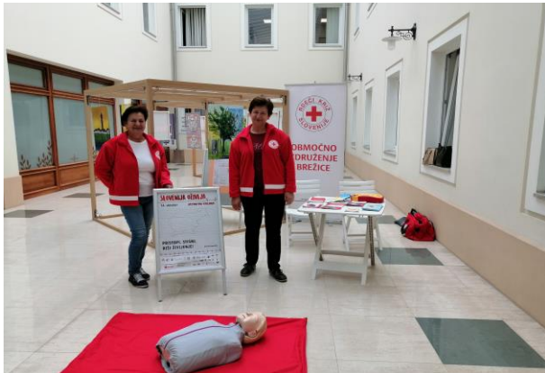
Delavnica TPO – avla UE Brežice