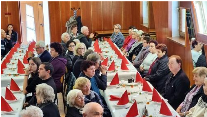
Srečanje starostnikov v Kapelah

zadovoljni in nasmejani obrazi prisotnih krajanov, prijetno vzdušje, so največja zahvala in vzpodbuda organizatorjem, za njihovo delo.