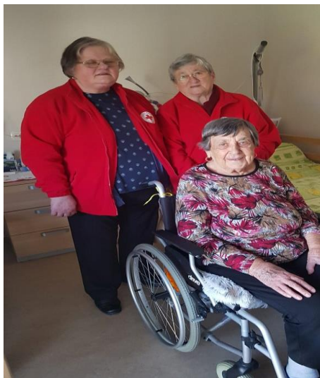
Obisk v DSO