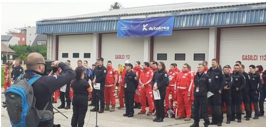
Regijsko preverjanje ekip PP, Brežice