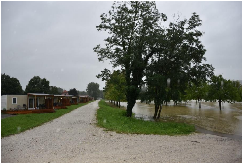
Poplava v kampu Terme Čatež

Nedelja 6. 8. 2023: 4 prostovoljci so bili v noči iz sobote na nedeljo dežurni in poskrbeli za varnost nastanjenih turistov. Zaradi poslabšanih razmer v kampu sta bili tekom noči v športno dvorano, ob spremstvu policije okoli 2.00 ure zjutraj, pripeljani še dve družini. Zaradi nastale situacije je bilo pričakovati dodatne naselitve, zato so se pojavile potrebe po dodatnih odejah. Zjutraj so se razmere pričele umirjati. Prostovoljci OZRK Brežice smo podrobno informirali svoje varovance o stanju v kampu, zato so se vsi odločili vrniti. V dogovoru z odgovornimi iz Term Čatež smo pripravili popis oseb za nemoten povratek. Zajtrk smo organizirali v Bolnici Brežice ob 8.30 uri. Po zajtrku so turisti pospravili svoje stvari in po 11.00 uri vsi zapustili športno dvorano. Z namestitvijo in ustrežljivostjo ter profesionalnim odnosom prostovoljcev OZRK Brežice so bili zelo zadovoljni.