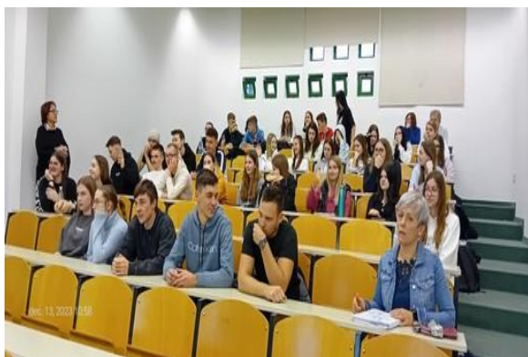
Predavanja dijakom o krvodajalstvu in prostovoljstvu

Dijakom in profesorjem smo se zahvalili za sodelovanje, v upanju, da se odločijo in postanejo krvodajalci. Povabili smo jih, da se nam pridružijo v čim večjem številu na naslednjih akcijah v letu 2024.