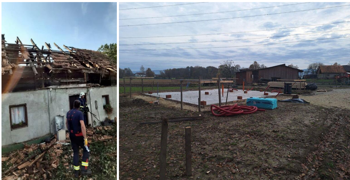
V neurju prizadet dom