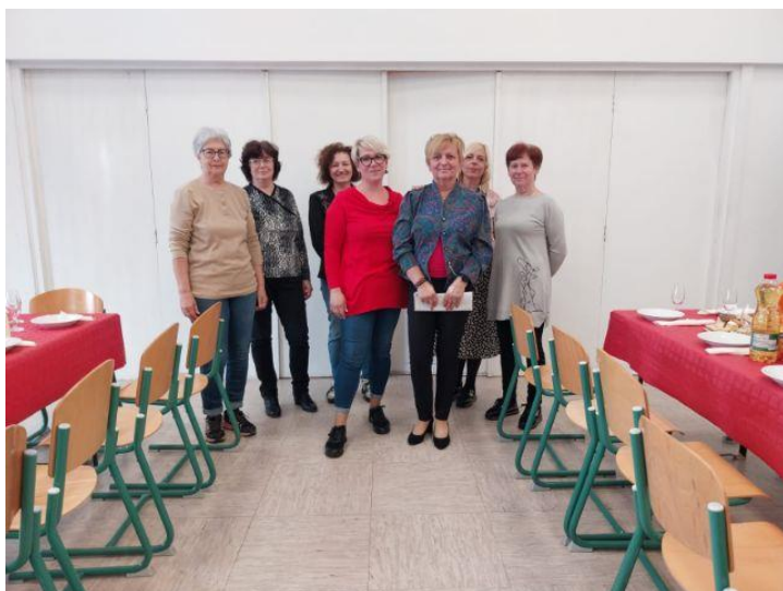
Prostovoljke KORK Velika Dolina