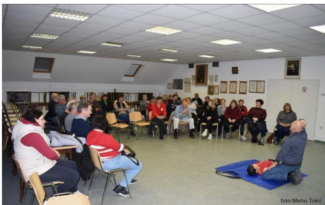
Delavnica TPO- KO RK Krška vas