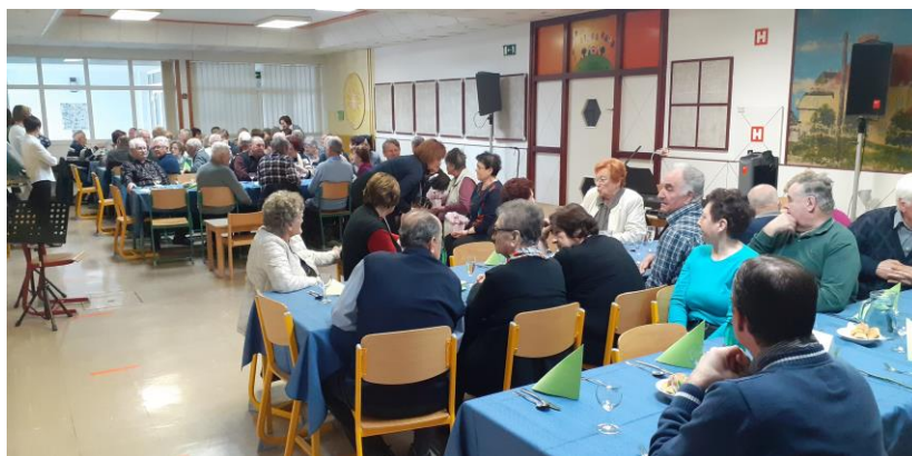
Srečanje starostnikov v Artičah