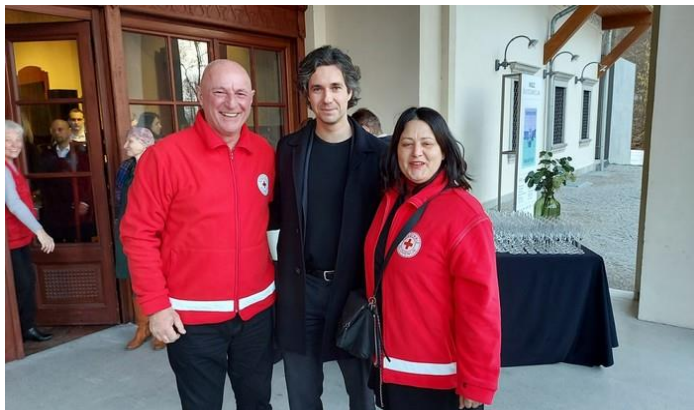
sprejem pri ministru