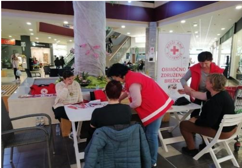
Meritve krvnih substanc