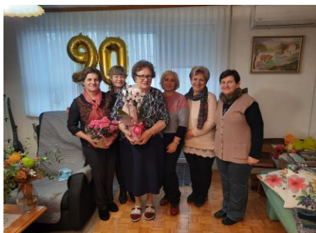
Praznovanje 90 letnic v Pišecah