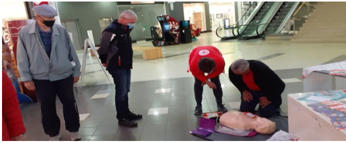
Prikaz postopkov oživljanja na lutki