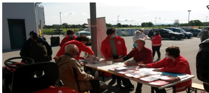
Meritve sladkorja pri Kmetijski trgovini Cerjak

2. V tednu Rdečega križa je v soboto 15. 5. 2021 OZRK Brežice izvedlo brezplačne meritve krvnega sladkorja in pritiska pri Kmetijski trgovini Cerjak. Meritev se je udeležilo 75 uporabnikov. Akcija je bila med občani odlično sprejeta.