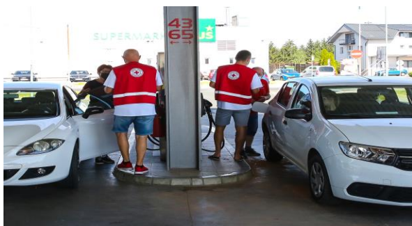
Akcija na bencinskih servisih »REŠIMO KRIŽE IN TEŽAVE NA POTI«

OZRK Brežice so ozaveščali voznike in sopotnike na kaj morajo biti pozorni, ko se odpravijo na pot in jim v ta namen izročili zgibanko s koristnimi napotki. Zgibanko smo pripravili sami in jo natisnili. Skupaj je bilo razdeljeno 788 plastenkov vode in 600 zloženkov. Sodelovalo je 10 prostovoljcev.